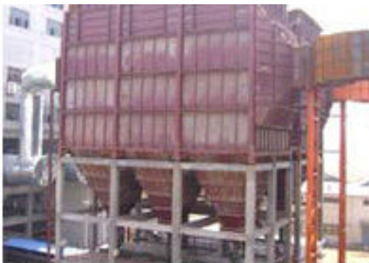
• LFS- I 型双层布