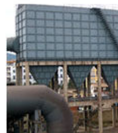
LMF- I 型脉动反