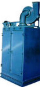
• HD 系列单机除尘