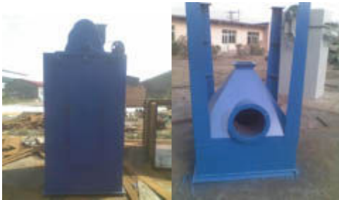
• 袋式收尘 UF 单机 •